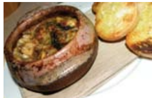
TRIPES DE VEAU ET HARICOTS, CUITES À L'ÉTOUFFÉE AU FOUR À BOIS DANS UNE MINI COCOTTE DE TERRE CUITE