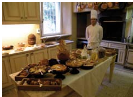
LA CUISINE OUVERTE POUR LES PETITS-DÉJEUNERS

Côté bien-être l'Andana propose les bienfaits d'un jacuzzi et des soins et massages du visage et du corps au centre Espa. Côté détente et loisirs, vous pouvez opter pour la piscine extérieure chauffée, le golf 3 trous, le tennis, des balades à bicyclette ou des promenades équestres. ♦