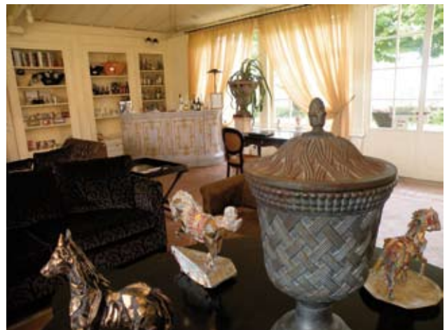
LA PIÈCE D'ACCUEIL AVEC LE BAR EN ARRIÈRE-PLAN