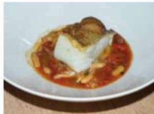
MORUE ASSORTIE DE POIVRONS ROUGES, HARICOTS ET SAUCISSES

• L'Andana. Châteaux et Hôtels Collection Tenuta La Badiola – Località Badiola 58043 Castiglione della Pescaia (Grosseto) Tél. +39 0564 944 800 - http://www.andana.it info@andana.it