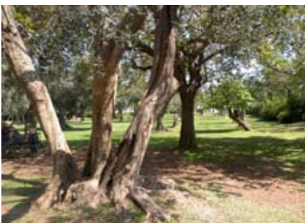
Le jardin de l'olivaie