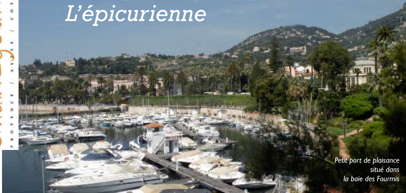
Petit port de plaisance situé dans la baie des Fourmis

Vous ne pouvez pas vous imaginer toutes les richesses culturelles, le patrimoine architectural et les plaisirs gourmands, que recèle cette commune idéalement située entre Nice et la principauté de Monaco.