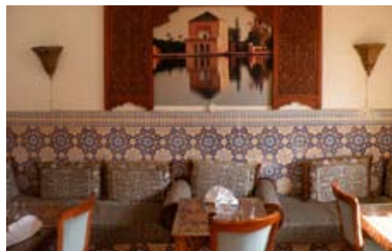
Le petit Darkoum

confite au miel, au café lounge brasserie Le Beaulieu (45, avenue Marinoni – tél. (0)4 93 01 03 36) où le midi, la grande assiette tout saumon (fumé, mariné, tartare, vapeur) fait fureur.