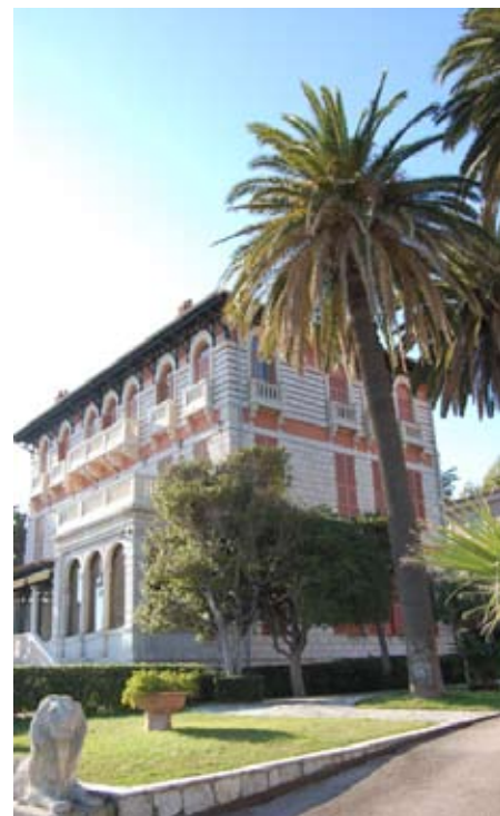
L'hôtel résidence Eiffel

à une nouvelle vie tout comme son voisin l'hôtel Le Métropole ; La Réserve et sa salle de restaurant qui n'a pratiquement pas connu de modifications depuis sa création en 1880.