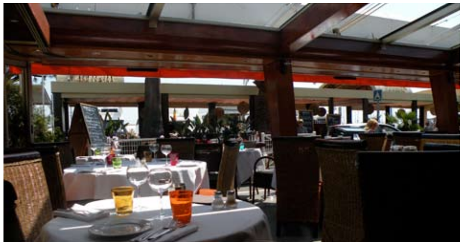
La terrasse de l'African Queen