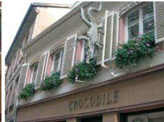
«Au crocodile» à Strasbourg