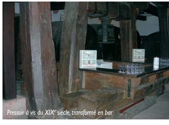
Pressoir à vis du XIX e siècle, transformé en bar