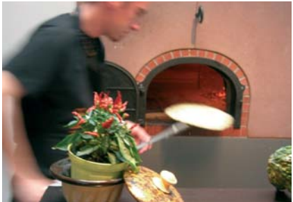
Flammekueche cuite au feu de bois au d'Brendelstüb