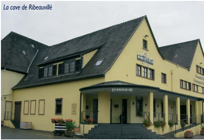
La cave de Ribeauvillé