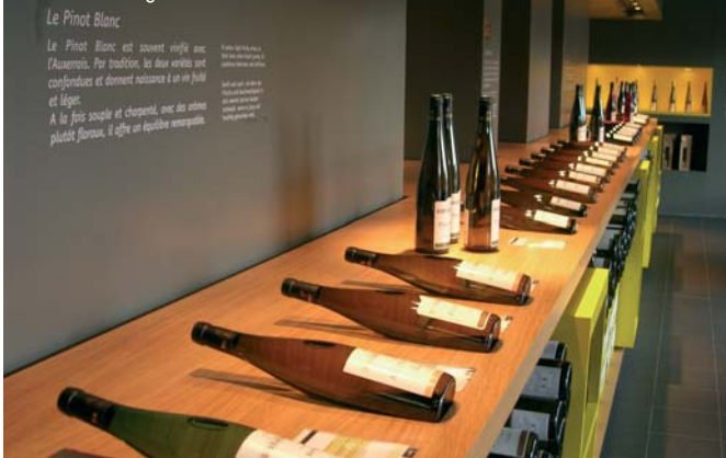
Le caveau de dégustation