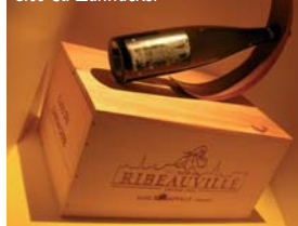
Clos du Zahnacker

Tél. (0)3 89 47 92 51 - http://www.dopff-irion.com