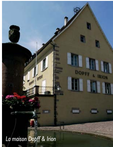
La maison Dopff &amp; Irion

2, route de Colmar 68150 Ribeauvillé. Tél. (0)3 89 73 61 80 - http://www.cave-ribeauville.com