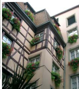
Hôtel Beaucour Baumann