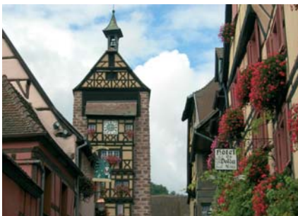
Le village de Ribeauvillé