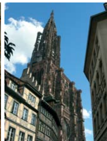
Maison Kammerzell à Strasbourg