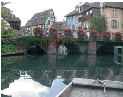
La Petite Venise à Colmar