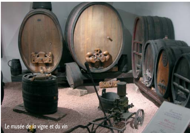
Le musée de la vigne et du vin