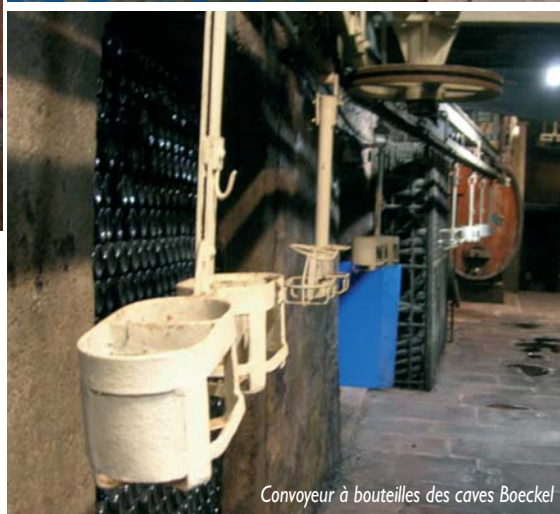
Convoyeur à bouteilles des caves Boeckel