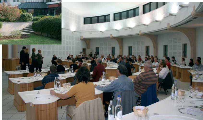
Salle de dégustation

12, avenue de la foire aux vins 68000 Colmar Tél. (0)3 89 20 16 20 - http://www.vinsalsace.com