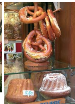
Bretzels et kouglofs