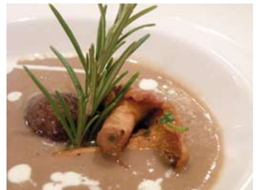
VELOUTÉ DE CHÂTAIGNES

Route de Tahiti 83990 Saint-Tropez Tél. (0)4 94 56 76 00