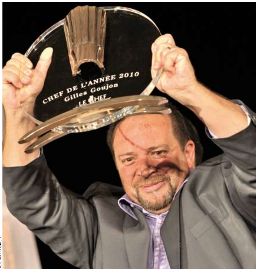
GILLES GOUJON, CHEF DE L'ANNÉE 2010