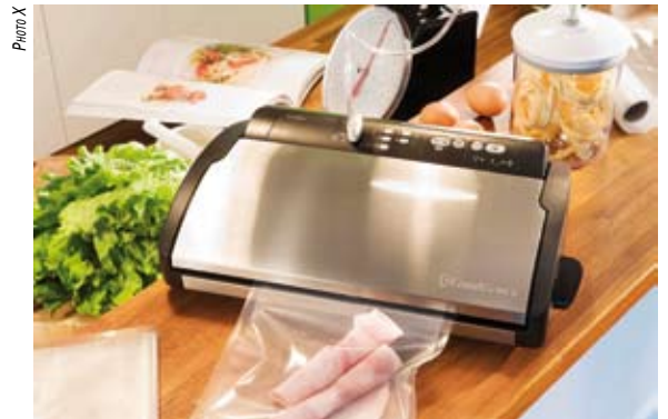
LE V2860-I, LE FLEURON DE LA MARQUE, AVEC DES FONCTIONS PLUS ÉLABORÉES COMME LE CHOIX DE VITESSE D'ASPIRATION, GARANTISSANT L'INTÉGRALITÉ VISUELLE DES PRODUITS MIS SOUS VIDE (179€ PRIX INDICATIF)