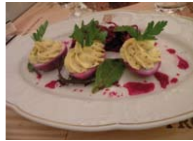
ŒUFS MIMOSAS, BETTERAVES EN SALADE

http://www.oasis-raimbault.com - contact@oasis-raimbault.com