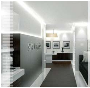
LE U SPA BARRIÈRE