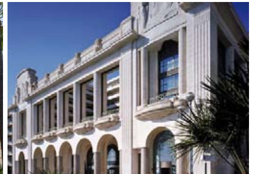
LE PALAIS DE LA MÉDITERRANÉE À NICE