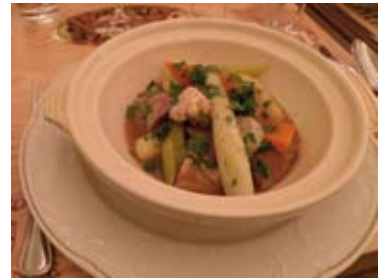
TÊTE DE VEAU SAUCE GRIBICHE