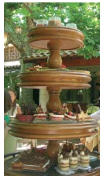
La caravane des desserts