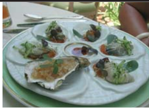
Sushi d'huîtres de Bouzigues en salade de concombre au caviar de saumon

• Restaurant L'Oasis à La Napoule. Tél. (0)4 93 49 95 52 – www.oasis-raimbault.com