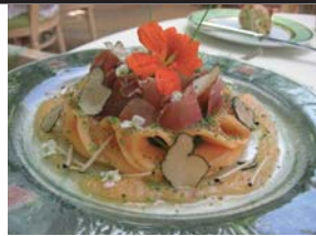
Fraise de melon et prosciutto aux truffes de la Saint Jean