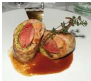
CÔTELETTE DE PIGEON FARCIE AU FOIE GRAS

Hôtel Belles Rives 33, boulevard Edouard Baudoin 06160 Juan-les-Pins Tél. (0)4 93 61 02 79 info@brj-hotels.com - http://www.bellesrives.com