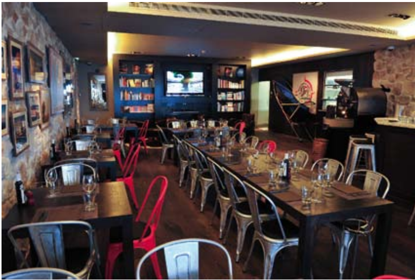
LA SALLE DE RESTAURANT, AVEC AU FOND UNE BIBLIOTHÈQUE, POUR VOUS PERMETTRE D'APPROFONDIR VOS CONNAISSANCES, TECHNIQUES, HISTORIQUES ET GÉOGRAPHIQUES, OU SIMPLEMENT D'ORGANISER UNE FUTURE EXPÉDITION