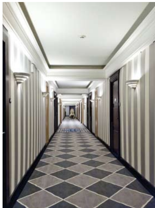
UNE NOUVELLE PARURE HABILLE LES COULOIRS DE L'HÔTEL

Également, en complément de ces nouvelles chambres « prestige vue mer », cinquante autres chambres de catégories diverses ont profité d'un embellissement. À la mesure de la superficie du Martinez (7 étages - 40 000m 2 ), ce prestigieux «relooking» a nécessité 4 Km de moquette et 6 Km de tapisserie murale. Fidèle à l'esprit Art déco de l'hôtel, le losange «HM» est mis en scène dans un design rectiligne aux coloris de bleu, de gris lumineux et de blanc.