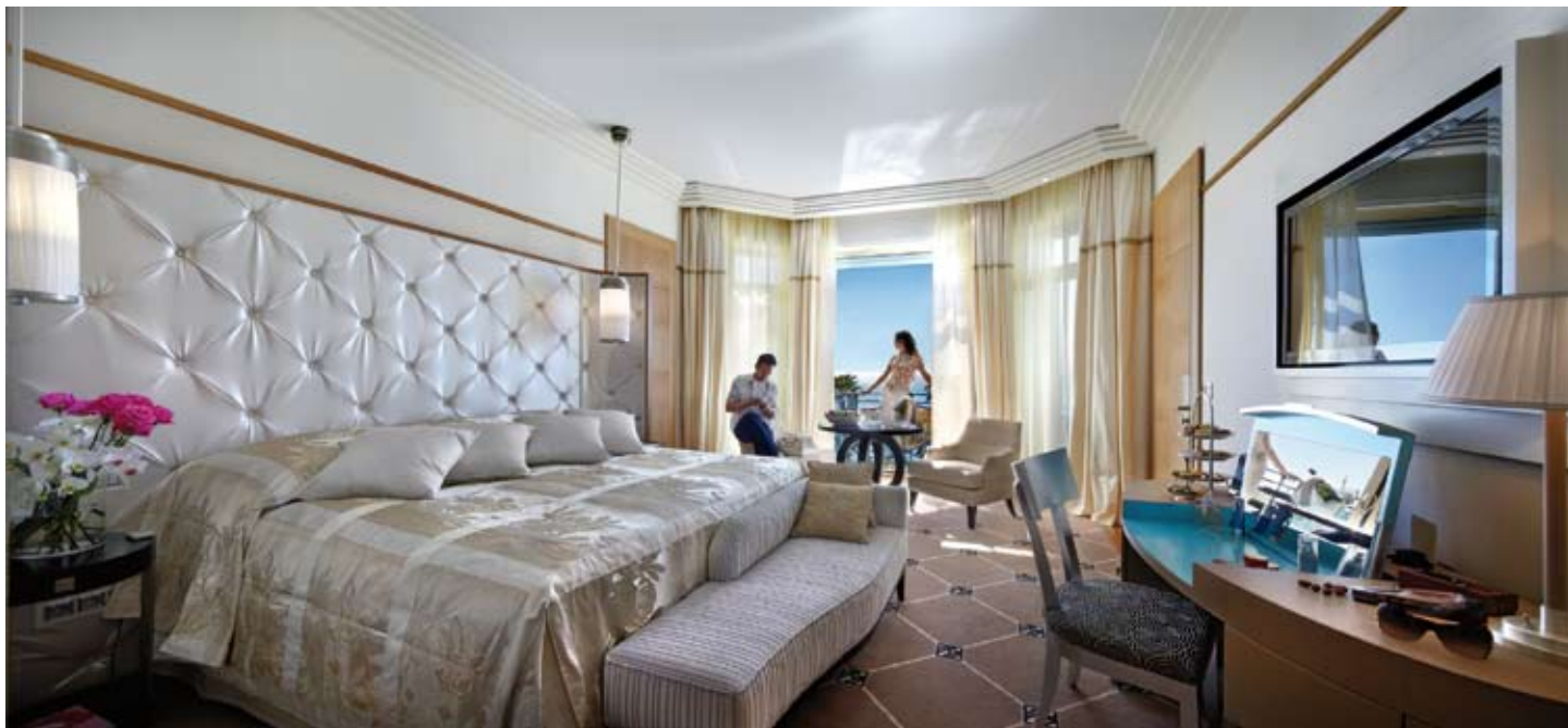
UNE DES NOUVELLES CHAMBRES « PRESTIGE VUE MER »