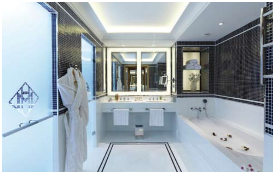
LA SALLE DE BAINS

■ HÔTEL MARTINEZ***** 73, La Croisette 06400 Cannes Tél. (0)4 92 98 73 00 http://www.hotel-martinez.com