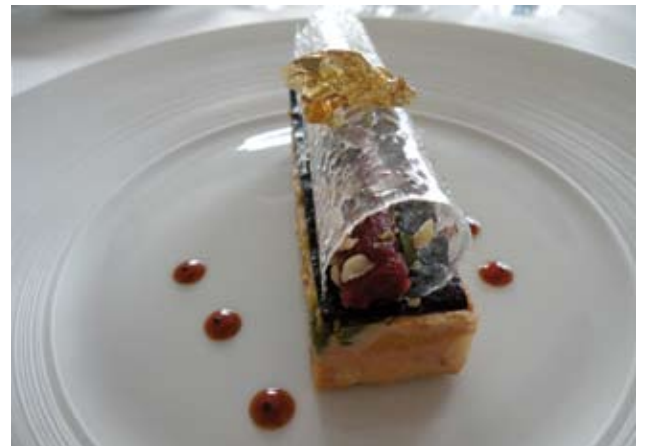
NOUGAT DE FOIE GRAS, AUX PETITS FRUITS SECS, COMPOTE DE FIGUE AU VIN ROUGE