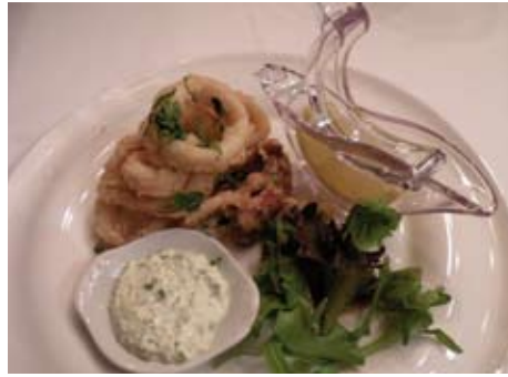
FRITURE DE CALAMARS FRAIS SAUCE TARTARE, PETITE SALADE DU PAYS