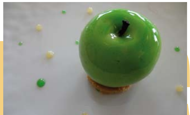
POMME GRANNY SMITH EN BAVAROISE ET SAVEUR MANZANA