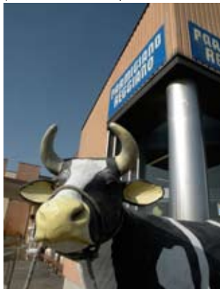
COOP. CASEARIA CASTELNOVESE A CASTELNUOVO RANGONE

• Coop. Casearia Castelnovese Via Cavidole, 6 - 41051 Castelnuovo Rangone Tél. +39 059 535364 Ouvert de 8h30 à 12h30 et de 15h à 19h (15h30 à 19h30 l'été)