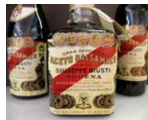
DIFFÉRENTS VINAIGRES BALSAMIQUES TRADITIONNELS DE MODÈNE D'ACETAIA DEL CRISTO ET DE GIUSEPPE GIUSTI