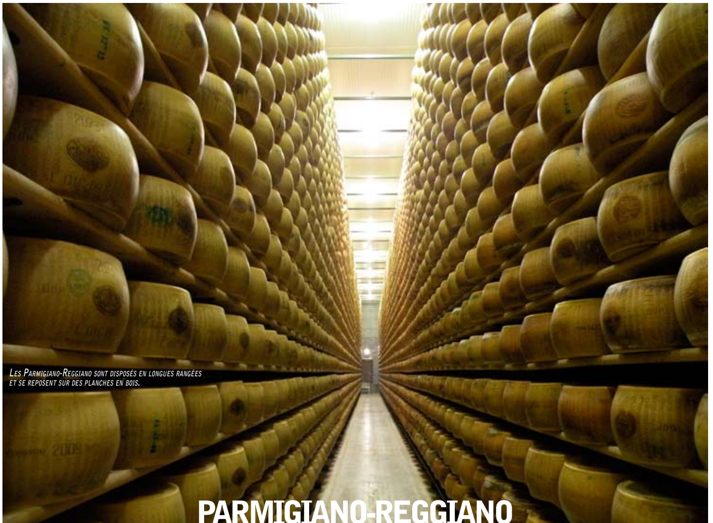
LES PARMIGIANO-REGGIANO SONT DISPOSÉS EN LONGUES RANGÉES ET SE REPOSENT SUR DES PLANCHES EN BOIS.