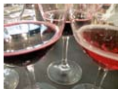
LE LAMBRUSCO SE CARACTÉRISE PAR UNE MOUSSE QUI CEINT LE VERRE