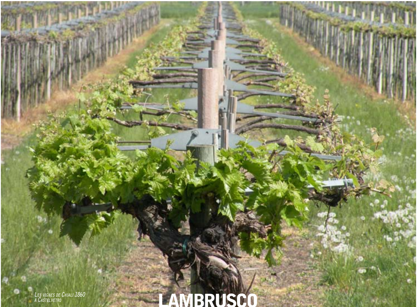
LES VIGNES DE CHIALLI 1860 À CASTELVETRO