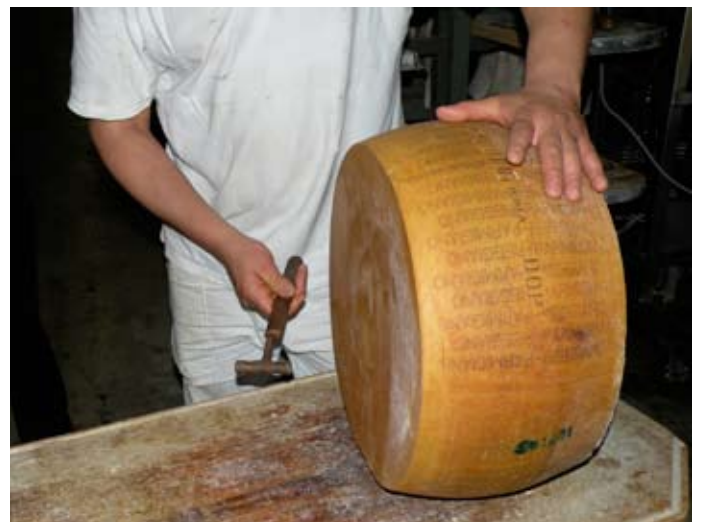
LE PARMIGIANO-REGGIANO SE PRÉSENTE SOUS LA FORME D'UN GROS CYLINDRE DE 35 À 40 CM DE DIAMÈTRE ET DE 18 À 25 CM D'ÉPAISSEUR, POUR UN POIDS VARIANT DE 24 À 40 KG