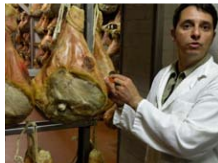
AU TERME DE LA MATURATION ET APRÈS DIFFÉRENTS CONTRÔLES, LES JAMBONS REÇOIVENT DIFFÉRENTS CACHETS