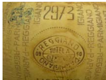
LE FROMAGE EST MARQUÉ DE L'EMPREINTE «PARMIGIANO-REGGIANO CONSORZIO TUTELA»