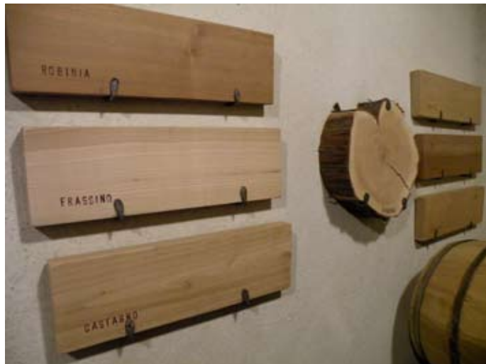
LES TONNELETS SONT FABRIQUÉS DANS DES BOIS DIVERS

En conclusion, il faut bien faire la différence entre le vinaigre balsamique traditionnel de Modène AOP, obtenu exclusivement de 100 % de moût de raisin cuit, sans aucune addition de substances aromatiques, disponible uniquement dans la typique petite bouteille de 100 ml et les soi-disant produits qui arborent l'adjectif balsamique, et sont, en définitif, qu'un mélange de différents ingrédients. À Spilamberto, à quelques kilomètres au Sud de Modène, sur deux étages et dans différentes salles, le musée du vinaigre balsamique traditionnel vous permet de mieux comprendre la complexité de sa fabrication.