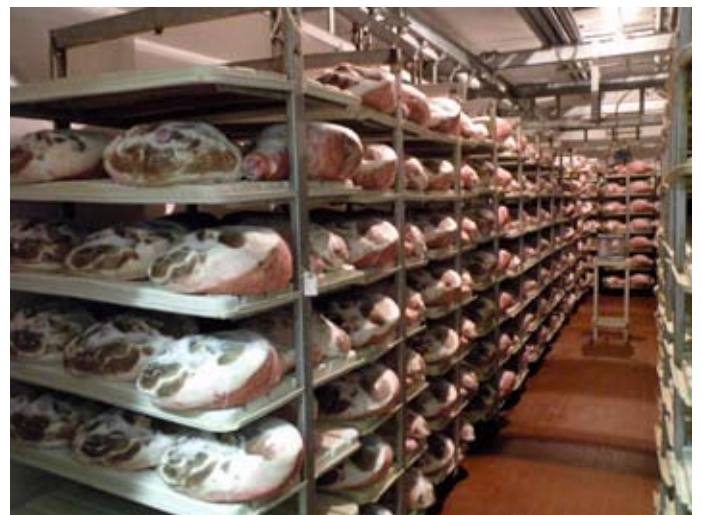
LES CUISSÉS SALÉES SONT PLACÉES DANS DES PIÈCES DE REPOS

La sélection rigoureuse des viandes de porcs, l'ancienne tradition qui oblige à utiliser comme seul conservateur le sel marin, savamment dosé, et la longue maturation, assurent au jambon de Modène suavité et grandes qualités nutritionnelles.