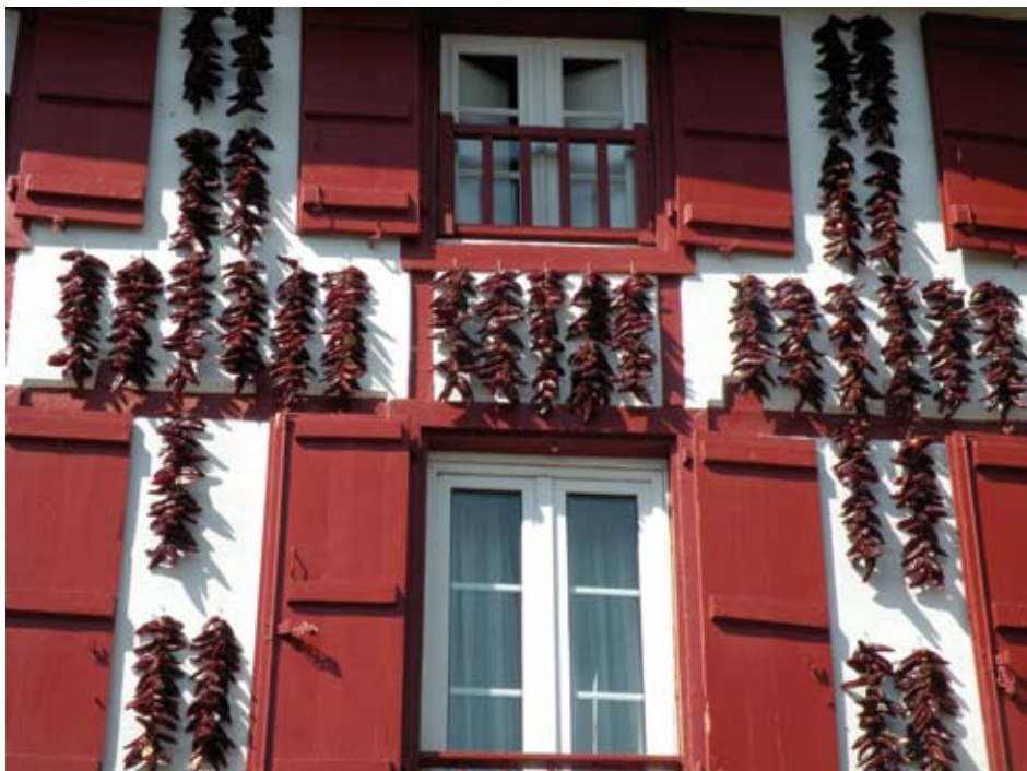
LES CORDES DE PIMENTS D'ESPELETTE SÈCHENT SUR LES FAÇADES DES MAISONS