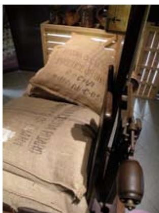
ESPACE SCÉNOGRAPHIQUE DÉDIÉ À L'HISTOIRE DU CHOCOLAT