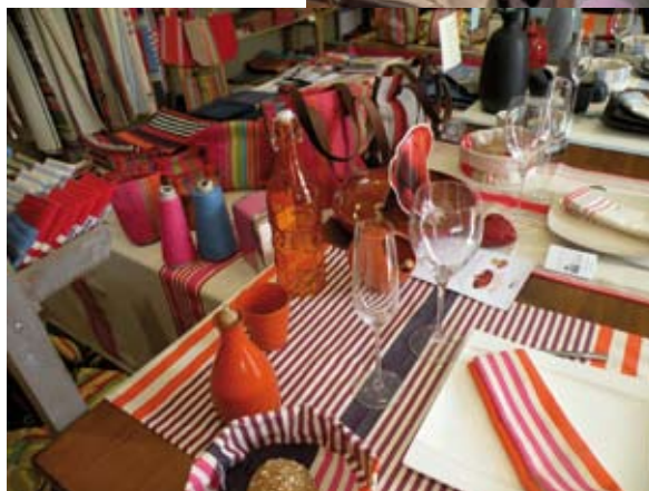
LINGE DE TABLE ARTIGA

A ne pas rater au mois de septembre (cette année, les 18 et 19), l'original concours international de photo culinaire, avec démonstrations de cuisine en direct, ateliers de dégustation, initiations culinaires, produits du terroir.