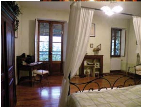
LA CHAMBRE «ESQUISSE» AVEC SON LIT À BALDAQUIN