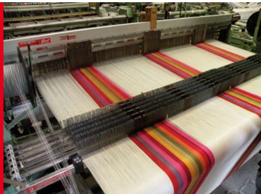
MACHINE À TISSER À L'ATELIER DE TISSAGES LARTIGUE