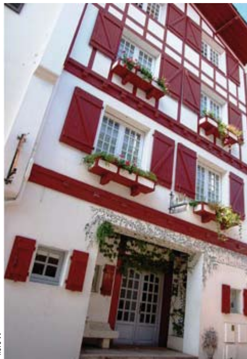
ENTRÉE DE L'HÔTEL « LA DEVINIÈRE »