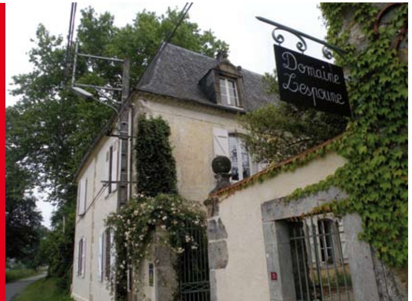
L'ENTRÉE DU DOMAINE LESPOUNE