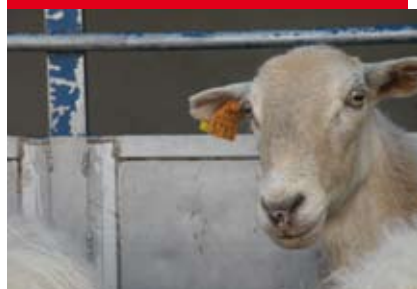
BREBIS RACE MANECH TÊTE ROUSSE

À quelques kilomètres de Navarrenx, les frères Erbin, producteurs fermiers à Angous ( de Navarrenx prendre D2 direction Mauléon, puis D 69 ), cultivent maïs, tournesol, métaïn (mélange de céréales), élèvent des brebis, race Manech tête rousse, et fabriquent de l'Ossau-Iraty fermier, depuis 1985, dans les règles de l'art, avec transhumance en été, où les animaux rejoignent les estives à Gavarny (pâturages d'altitude), ce qui assure un goût très fruité à ce fromage typiquement artisanal, et soins attentifs pendant plus de 3 mois, caillage, découpage, égouttage, brassage, chauffage, moulage, pressage, salage et affinage.