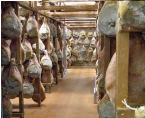
LA CAPACITÉ DE SÉCHAGE DES JAMBONS REPRÉSENTE ENVIRON 18 000 PIÈCES

Initialement éleveur de cochons au cœur de la montagne basque, entre 1983 et 1995, Jean-Baptiste Loyatho, dans l'obligation de se reconverter suite à la perte d'un œil, créé, en compagnie de sa femme, un atelier de transformation et de commercialisation de porcs de 3 000 m 2 . Ils choisissent, par passion, les produits crus séchés. Après la découpe des cochons, les jambons frais sont salés au sel de Salies-de-Béarn, stockés au saloir pour la prise de sel, panés à 6 mois (une couche de graisse est appliquée pour qu'il conserve tout son moelleux), séchés en plusieurs étapes de maturation, puis affinés de 12 à 16 mois, afin qu'ils développent toute leur saveur.