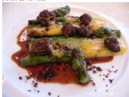
LES GROSSES ASPERGES VERTES, PRALINÉ DE MORILLES, JAUNE D'ŒUF DE POULE