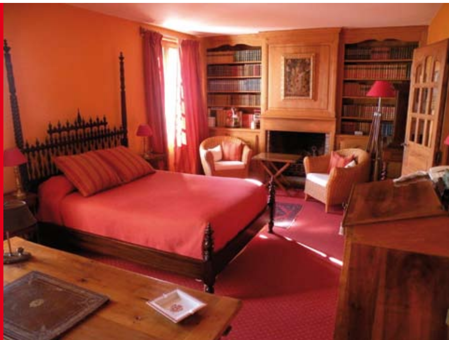
À DROITE, UNE CHAMBRE BIBLIOTHÈQUE AUX TONS CHAUDS ET MEUBLES D'ANTAN