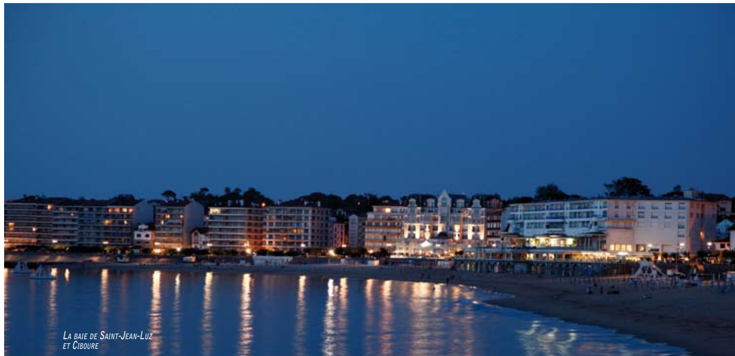
LA BAIE DE SAINT-JEAN-LUZ ET CIBOURE