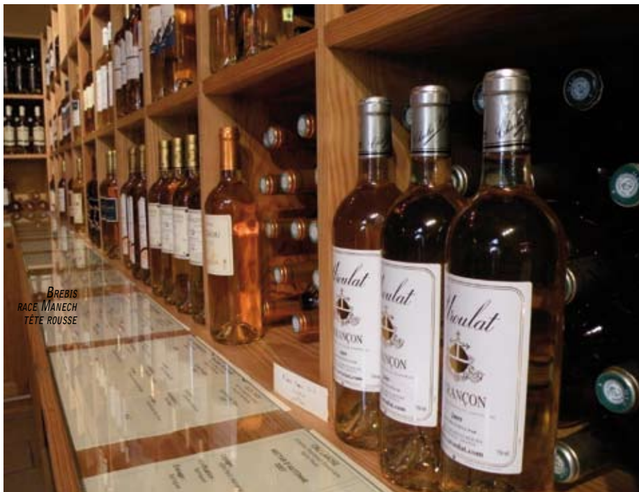
BREBIS RACE MANECH TÊTE ROUSSE