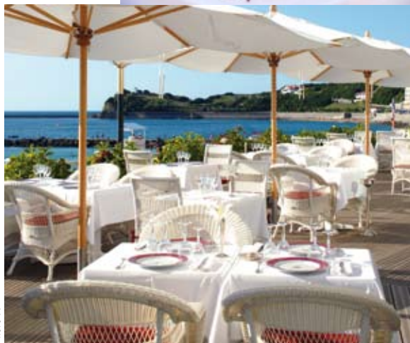
LA TERRASSE DU RESTAURANT « ROSEWOOD »