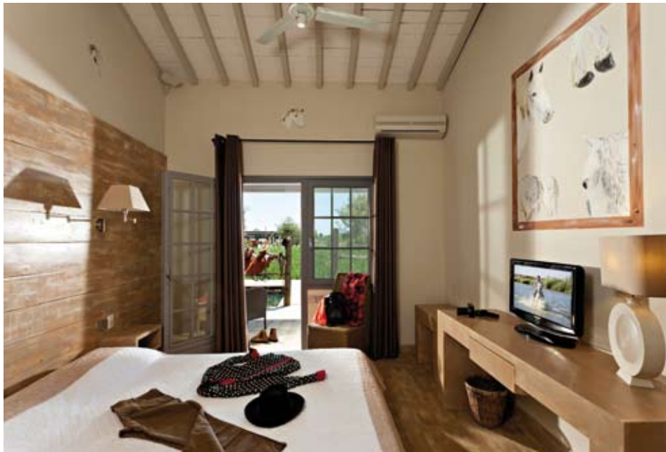
CHACQUE CHAMBRE DISPOSE DE SA PROPRE TERRASSE