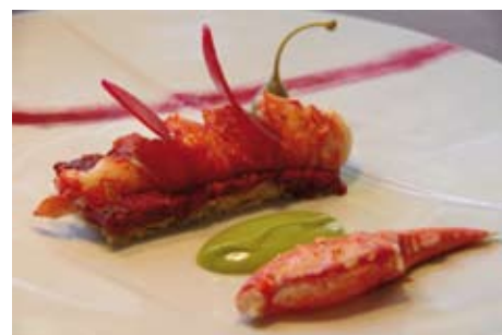
HOMARD BLEU D'EUROPE, CROUSTILLANT DE KADAÏF ET BETTERAVES ROUGES