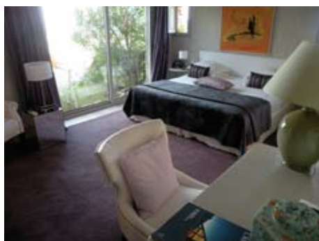
LA SUITE LE MÛRIER