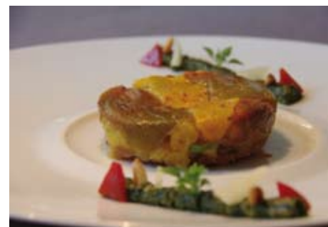
TOMATES ANCIENNES EN HARMONIE DE COULEURS