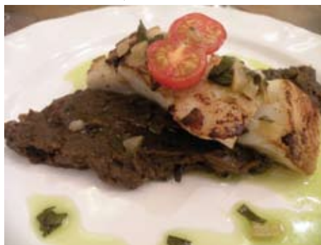
CABILLAUD RÔTI, CAVIAR D'AUBERGINES, SAUGE ET CITRONS CONFITS