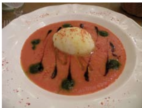
GASPACHO DE TOMATES CONFITES, BASILIC ET SORBET HUILE D'OLIVE

6, rue 11 novembre 83310 Cogolin Tél. (0)4 94 54 46 86 Fermé le lundi. Formule midi 22€ (entrée, plat, café ou plat, dessert, café). Menu 29€. Plats à l'ardoise.