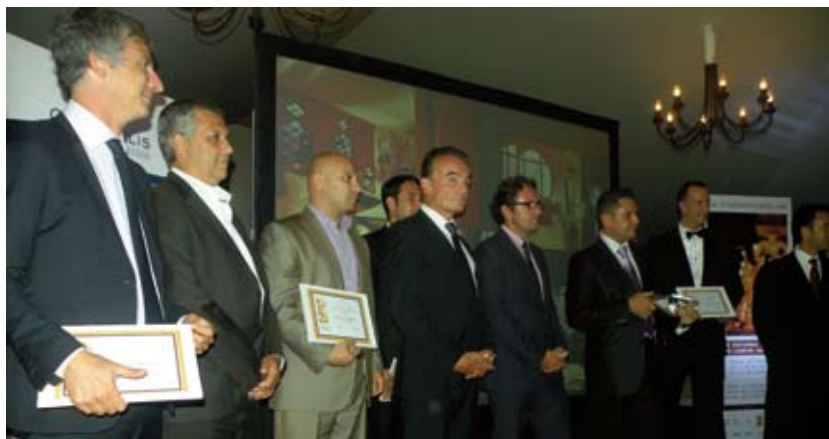
LES VAINQUEURS DE LA CATÉGORIE «HÔTELS DE LUXE»

Dans notre région ont été récompensés «Le Hameau» à Saint-Paul de Vence, meilleur hôtel de charme, le «Byblos» à Saint-Tropez, meilleur accueil, «Le Mas Candille» à Mougins, meilleur service, «L'Oasis» à La Napoule, meilleure cuisine et le «Chantecler», meilleur restaurant. ♦