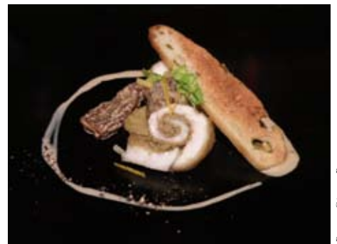
LOUP LAQUÉ À L'HUILE D'OLIVE