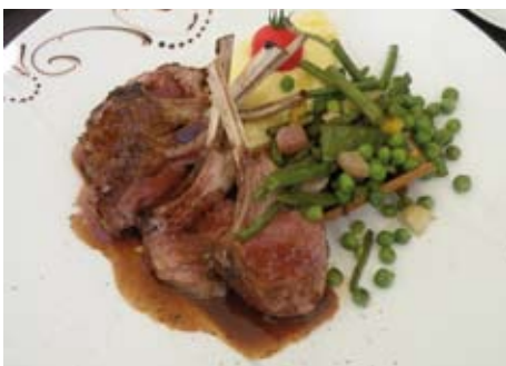
CARRÉ D'AGNEAU RÔTI AU THYM