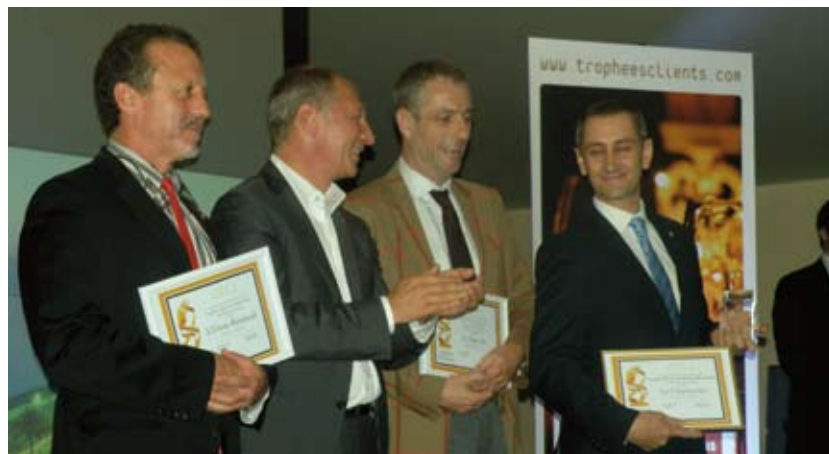
LES VAINQUEURS DE LA CATÉGORIE «RESTAURANTS GASTRONOMIQUES»