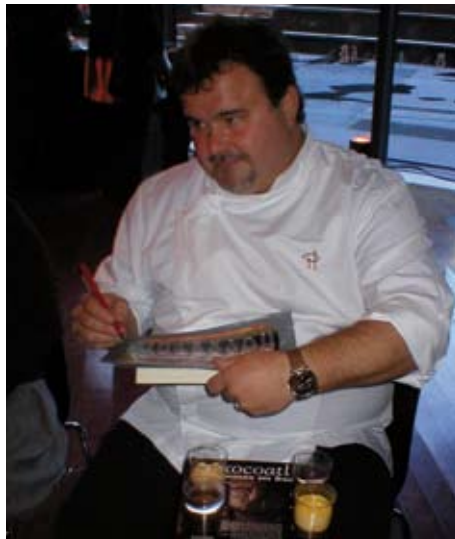
PIERRE HERMÉ, LE CÉLÈBRE CHOCOLATIER PÂTISSIER PARISIEN, ACCOMPAGNERA CETTE GÉNÉRALE BANDE DE COPAINS ET DEDICERA SON DERNIER LIVRE

LES PÂTISSIERS DE L'APRECA VOUS ATTENDENT DANS LES JARDINS EN RESTANQUES DE LA BASTIDE SAINT ANTOINE