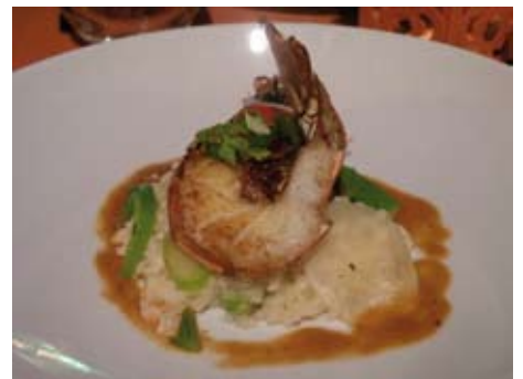
GAMBAS SAUTÉES ET SON RISOTTO CRÉMEUX