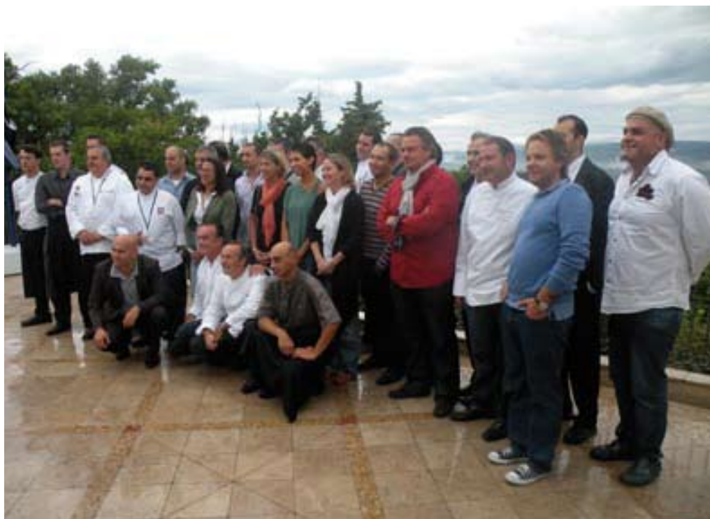
LES CHEFS LORS DU PETIT-DÉJEÛNER AU MAS CANDILLE