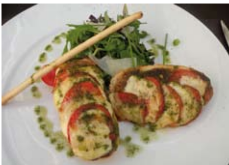
MICHETTE DE TOMATE MOZZARELLA JUSTE TIÉDIE, SALADE DE MESCLUN

Pour Christophe Ferré, il était évident qu'il fallait trouver un nouveau nom, mais également un bon équilibre dans l'assiette avec surtout un excellent rapport qualité-prix, pour fidéliser une clientèle de plus en plus regardante. Pari réussi avec sa formule du déjeuner, à prix doux, qui offre le choix de 6 entrées, 5 plats et 4 desserts, qui changent régulièrement suivant le marché, artichauts marinés et chèvre à la ciboulette, huile d'olive citron, michette de tomate mozzarella juste tiédie, salade de mesclun, brandade de morue gratinée au parmesan, salade de roquette (la présence de citron donne du punch au plat), tartare de bœuf et ses condiments, pommes rattes rôties au four, soupe de pêche blanche à la verveine et grosse madeleine, glace yaourt... Et si vous voulez vous faire plaisir avec un demi-homard bleu rôti au basilic, belle salade potagère ou un carré d'agneau rôti au thym, vous n'aurez pas à casser votre tire-lire, tellement les suppléments (10€ pour ces deux plats) sont anecdotiques. ♦