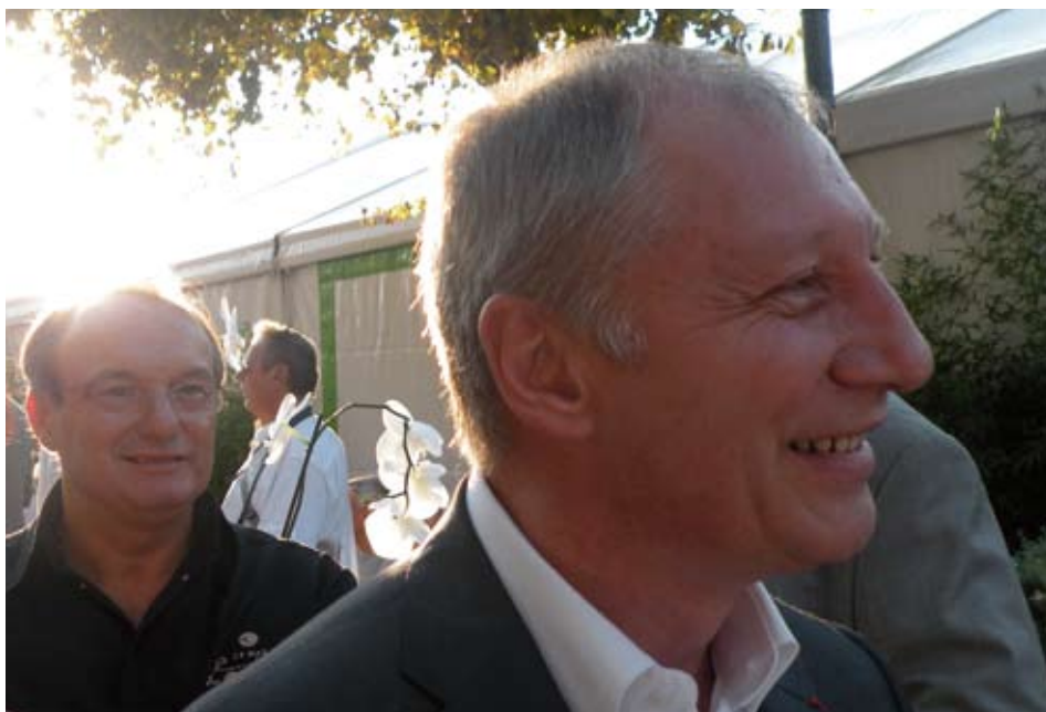
ÉRIC FRÉCHON, PARRAIN DE CETTE 6 E ÉDITION. EN ARRIÈRE-PLAN, SERGE GOULOUJÉS

La ville de Mougins, qui s'est portée candidate pour l'obtention du label «villes et métiers d'art» au titre de la gastronomie, a été une nouvelle le centre d'intérêt de tous les amateurs de gastronomie.