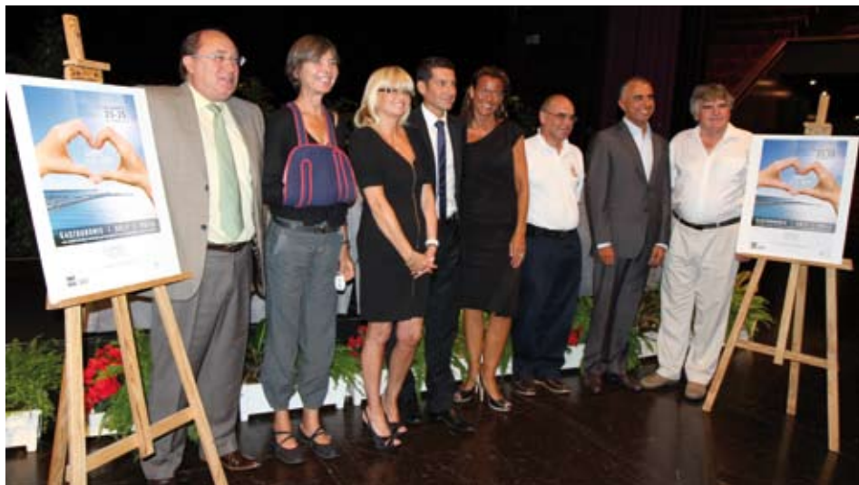
PARMI LES ÉVÉNEMENTS DE NOTRE RÉGION, CITONS L'INITIATIVE DU PALAIS DES FESTIVALS ET DES CONGRÈS DE CANNES, QUI CRÉE UN VÉRITABLE WEEK-END DU CŒUR (DU 23 AU 25 SEPTEMBRE), EN INCITANT LES RESTAURATEURS, PLAGISTES, HÔTELIERS CANNOIS À PARTICIPER À DES ACTIONS SOLIDAIRES, COMME LE REVERSEMENT À « ACTION CONTRE LA FAIM » DE 50 CENTIMES D'EUROS PAR COUVERT SERVI SUR LA JOURNÉE DU 23 SEPTEMBRE, ET UNE PARTICIPATION SUR LA BASE D'1€ PAR NUITÉE GÉNÉRÉE DURANT CE WEEK-END.

TERRE. Le vendredi 23 septembre, -et quelque fois plusieurs jours et même durant la semaine entière, comme l'opération «Tous au restaurant», du 19 au 25 septembre, avec la formule « Votre invité est notre invité ! » (liste des restaurants participants sur http://www.tousaurestaurant.com ) où le chef offre son menu au deuxième convive-, les acteurs de la gastronomie vont se mobiliser pour vous faire vivre une journée toute en saveurs. Placée sous le thème de « la terre », cette première édition a pour objectif de valoriser la diversité de la gastronomie, les produits, les savoir-faire, et de donner la parole aux différents acteurs du secteur : restaurants, marchés, cuisiniers amateurs, producteurs, arts de la table... Les produits, la cuisine et la créativité seront mis à l'honneur lors de cette journée à travers des visites, des animations spéciales ou encore des dégustations. ♦