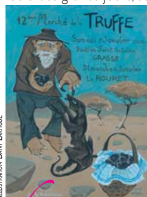
ILLUSTRATION DANY LARTIGUE

Dans le pays de Grasse, le premier week-end de l'année est traditionnellement consacré à la trufficulture. Étalée sur 2 jours, le samedi chez Jacques Chibois à Grasse à la Baside Saint Antoine et le dimanche au Rouret, cette manifestation, qui attire la foule des grands jours, sera parrainée cette année par Dany Lartigue, accompagné de nombreux artistes.