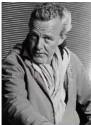
Alain Passard chef trois étoiles du restaurant L'Arpège à Paris