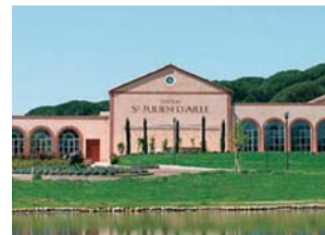
Château Saint Julien d'Aille