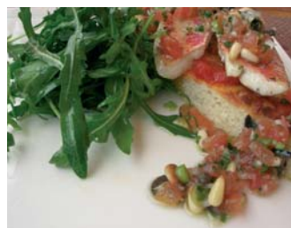
Filets de rouget servis sur une focaccia et sauce vierge

• Le Méridien Nice 1, promenade des Anglais à Nice Tél. (0)4 97 03 44 44