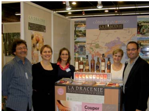
LE STAND DE « LA DRACÉNIE »

Le premier salon international de l'œnotourisme (SILOT), organisé par Vin'Events (filiale de Vinomedia), s'est tenu à Lyon du 15 au 17 mai 2009. PROMOTION. De nombreux exposants représentants les vignobles français et européens étaient présents. L'office de tourisme intercommunal de la Dracénie, présent sur le salon, a assuré la promotion de l'offre œnotouristique de son territoire, plus particulièrement celle que proposent les grands domaines tournés vers l'accueil, les réceptions, l'hébergement et l'animation. Le CIVP a édité une plaquette présentant ces domaines, plaquette largement diffusée sur le salon et maintenant mise à disposition des offices de tourisme de la communauté d'agglomérations de Draguignan. ♦