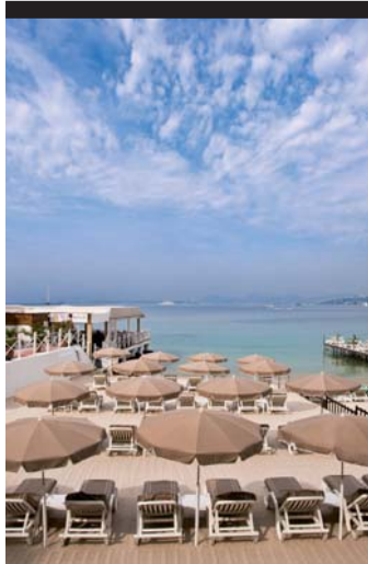
LA PLAGE DU PROVENÇAL BEACH ET SES TRANSATS