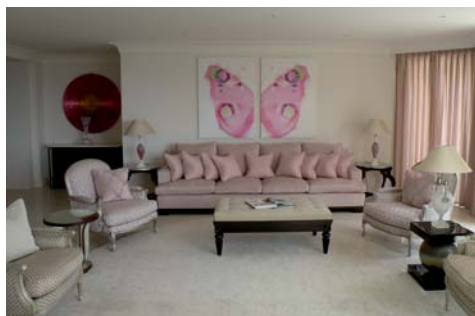
INTÉRIEUR D'UNE SUITE DU CAP ESTEL À EZE BORD DE MER